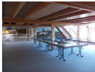
Blick in den Raum