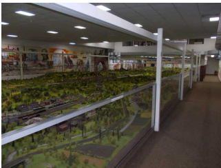
Modellbahnen Bereich "Thüringen"

Informationen zu den Exponaten werden schriftlich vermittelt. Informationen zu den Exponaten sind als fotorealistische Darstellung vorhanden.