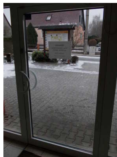
Eingangstür von innen

Name und Logo des Betriebes von außen klar erkennbar.