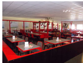
Blick ins Restaurant