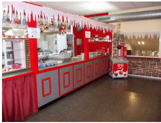
Theke im Restaurant

Rezeption / Kasse von der Eingangstür aus direkt erkennbar.