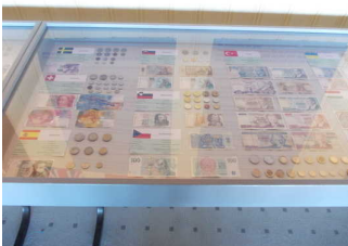
Unterfahrbare Glastische mit Exponaten