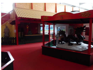
Allgemeiner Bereich "China"

Informationen zu den Exponaten werden schriftlich vermittelt.