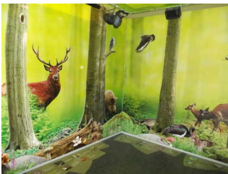
Blick in den Ausstellungsraum