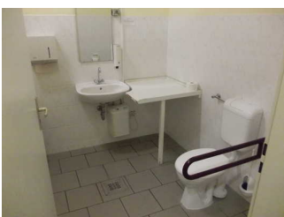
Behindertentoilette für Damen